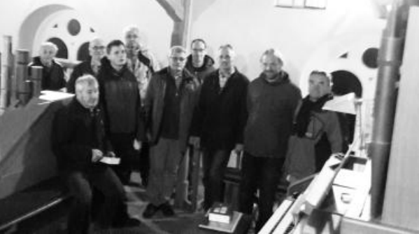
Adventliche Zusammenkunft auf der Orgel- empore der Kirche in Hohn am Berg