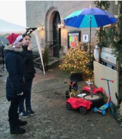
Wie klingt Weihnachten? Das wollen im Krippenspiel zwei Teenager auf dem Weihnachtsmarkt herausfinden.

Die Planungen liefen; Hänger als Bühne; Beschallung und Licht. Vieles kann man planen; manches auch nicht, z.B. ob das Wetter mitspielt und ob alle Mitwirkenden gesund bleiben. Die Generalprobe fand dann bei Dauerregen statt und drei Hirten waren leider krank. Selbst am 24.12. hat es leicht, aber stetig geregnet und einen Plan B gab es nicht. So manches Gebet haben wir losgeschickt. Und wirklich „GOTT SEI DANK“, Punkt 16:00 Uhr hörte der Regen auf und wir konnten beginnen.