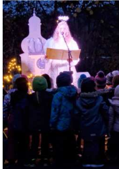
Das Christkind erinnerte gereimt an die vergangenen drei Jahre.

Der Abend für alle, die in unserer Gemeinde helfend mitarbeiten, ist für Freitag, den 5. Mai 2023, um 18:30 Uhr im Martin-Luther-Haus Aschbach geplant. Weitere Details werden noch bekannt gegeben.