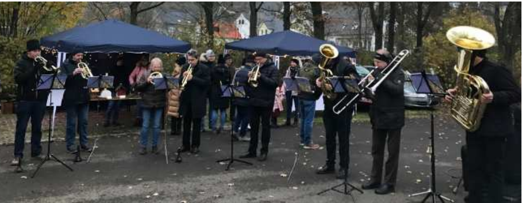
Der Posaunenchor eröffnet den Adventsabend.