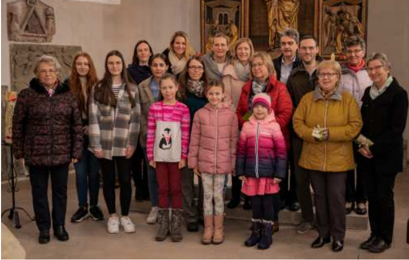
Das aktuelle Bücherei-Team, dazu ehemalige Mitarbeiter:innen.